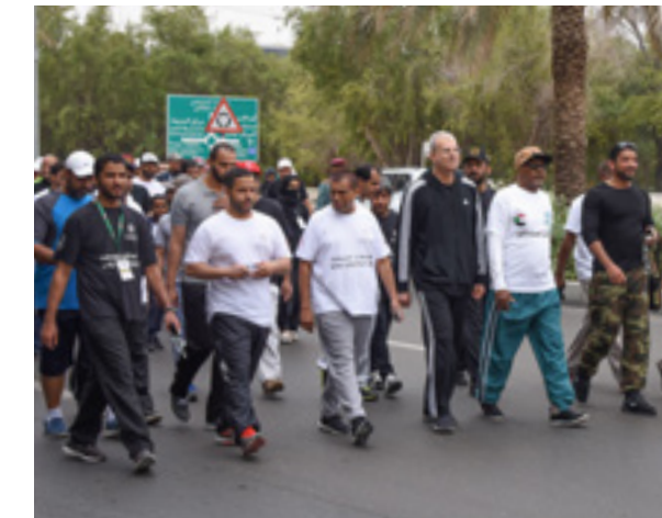
An efficient participation of AAU in the "UAE National Sports Day", as a support for the sport and cultural initiatives of the UAE.