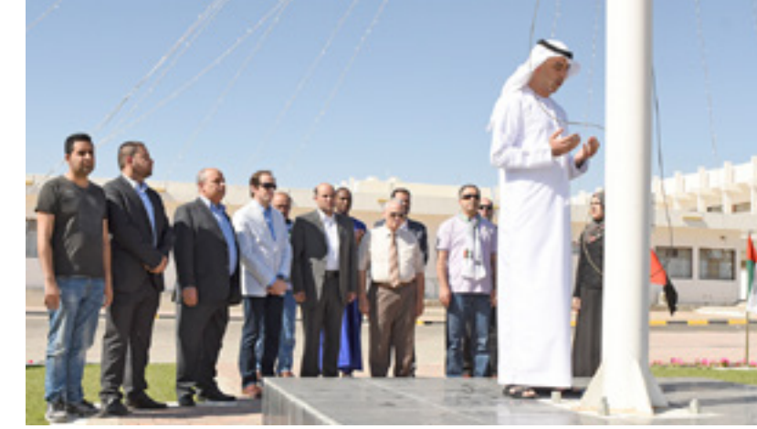
Participation in "Commemoration Day" in recognition of honoring and respecting the martyrs souls.