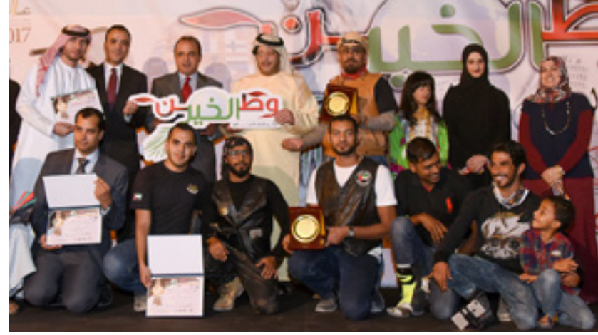
Participating in the initiative "Giving Nation, in all languages of the world", to spread the culture of charitable work and volunteering.