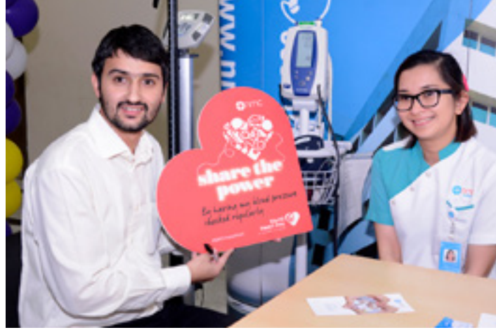
أنشطة صحية حيوية تنظمها الجامعة لتعزيز صحة الطلبة والأفراد ونشر الوعي بينهم