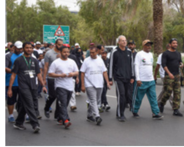
مشاركة فعالة لجامعة العين في "اليوم الرياضي الوطني" دعماً للمبادرات الرياضية والثقافية لدولة الإمارات