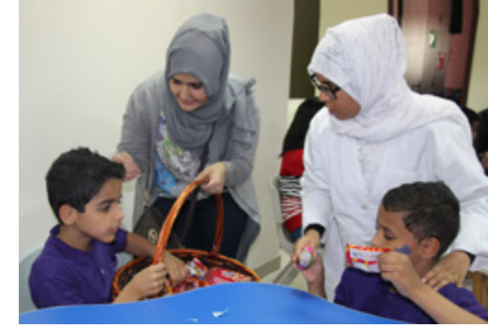
Different activities for children in the "World Autism Day" to provide them with the necessary care.