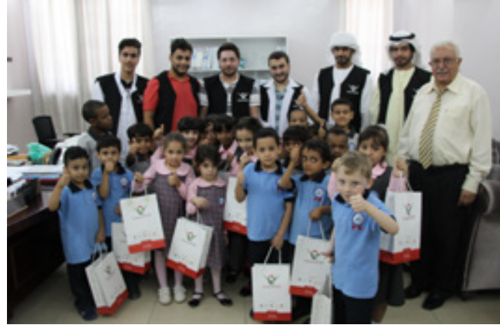
جامعة العين ترفع شعار "بالعلم نرتقي" لإدخال البهجة في نفوس الأطفال من خلال توزيع القرطاسيات المدرسية