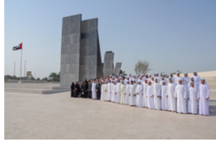
زيارة وفد من جامعة العين لـ "واحة الكرامة" تخليداً لذكرى شهداء الوطن