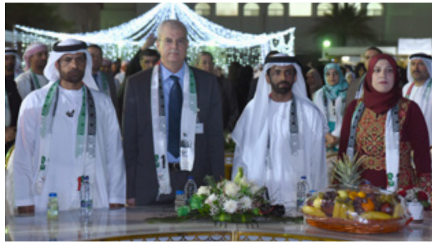
AAU annually excels in celebrating the "UAE National Day" expressing the values of loyalty and its gratitude to the nation and its wise leadership.