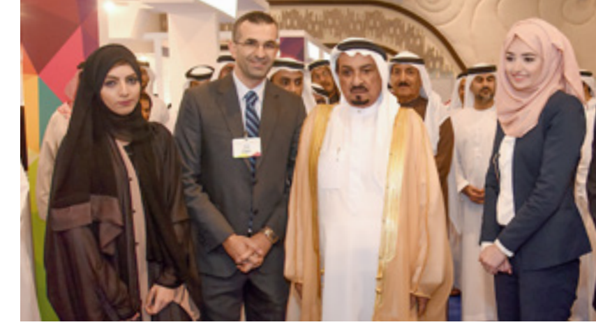
المشاركة في معارض التعليم والتدريب في الدولة، بهدف توجيه الطلبة وإرشادهم، واستقطاب الكوادر الوطنية الطموحة