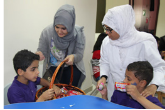
فعاليات متنوعة للأطفال في اليوم العالمي للتوحد لتعزيزاً لفكرة دمجهم في المجتمع وتقديم العناية اللازمة لهم