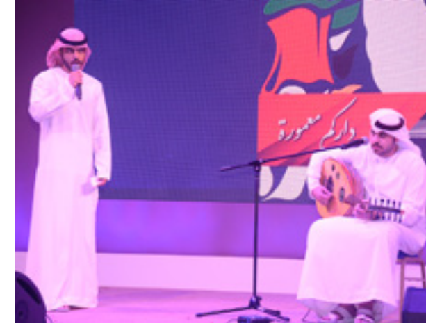
طلبة جامعة العين يشاركون في فعالية "قافلة زايد الخير الثقافية" والتي تهدف لتعزيز قيم الخير التي أسسها الوالد زايد