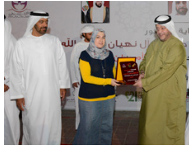
Participating in "Mother you are all Kind of Amazing" event seeks to integrate the "People of Determination" into society and honoring their mothers.