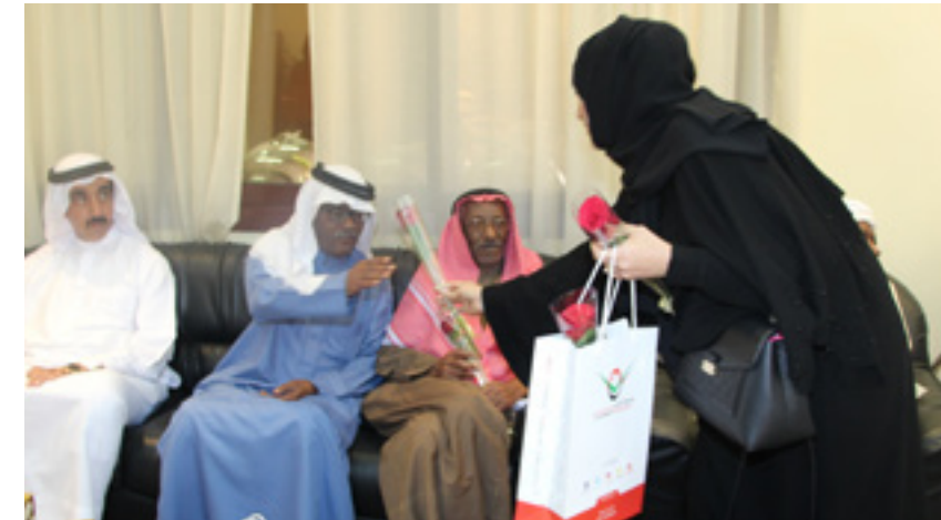
A visit to the "Elderly Care Homes" in order to promote the concept of honoring parents and to take care of them.