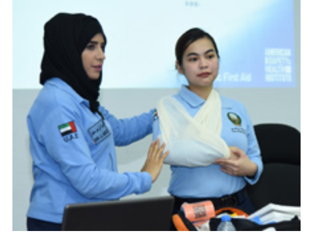
Organizing various cultural activities to promote awareness among students.