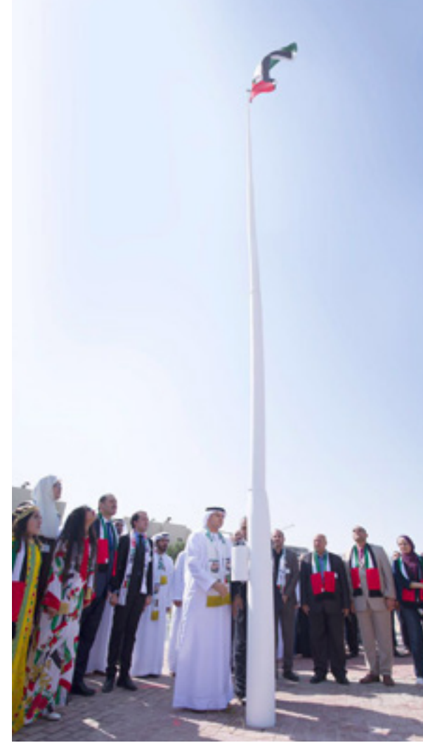
أسمى معاني السلام والشموخ والتسامح تشهدها جامعة العين لحظة رفع علم دولة الإمارات ليرفرف في سماء الجامعة احتفالاً بـ "يوم العلم"