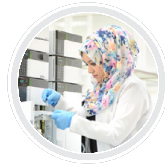
The renewal of the international accreditation (ACPE) of the college of pharmacy for four years.