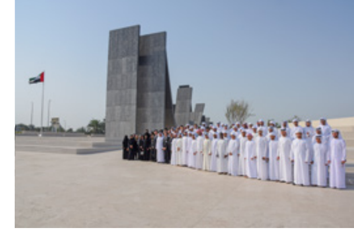
The visit of AAU delegation to "Wahat Al Karama" to mark the memory of "UAE Commemoration Day".