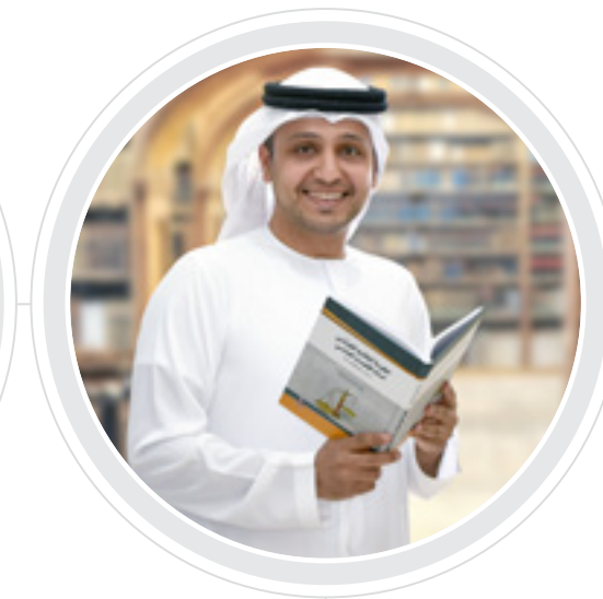
The College of Law obtained full accreditation for Master of Law (Public and Private).