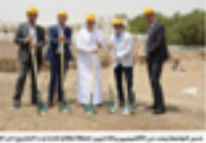
موقع مشروع توسعة مقر جامعة العين للعلوم والتكنولوجيا

انطلق مشروع توسعة مقر جامعة العين للعلوم والتكنولوجيا، الذي يهدف إلى تحسين البنية التحتية وتوفير بيئة أكاديمية أفضل للطلبة والباحثين. ويشتمل المشروع على إنشاء مباني جديدة وتجهيزها بأحدث المعدات والتقنيات.