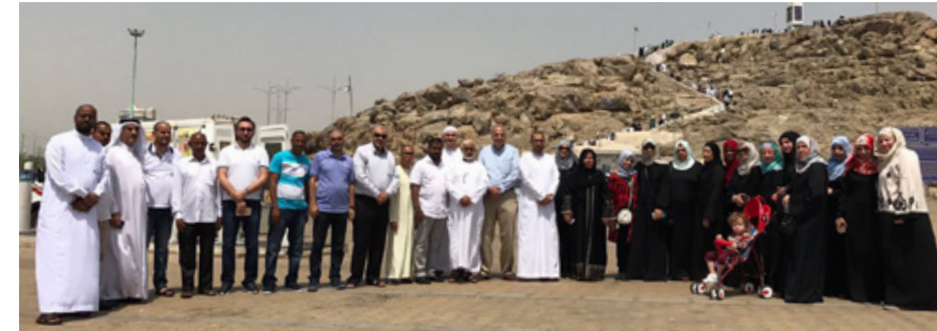
AAU grants its employees to perform Umrah as a part of the "Year of Giving".