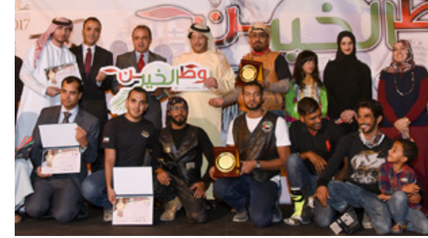
جامعة العين تشارك في فعالية "وطن الخير لكل لغات العالم" والتي تدعو إلى نشر ثقافة العمل الخيري وحب التطوع