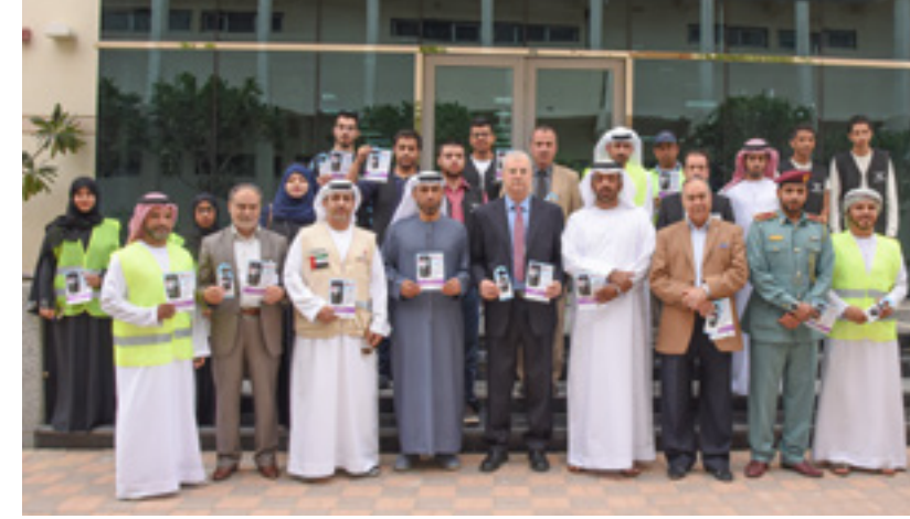
المساهمة في خلق ثقافة توعوية بين الشباب حول خطورة استخدام الهواتف النقالة أثناء القيادة، من خلال المشاركة في مبادرة "حياتي أهم من اتصالاتي"