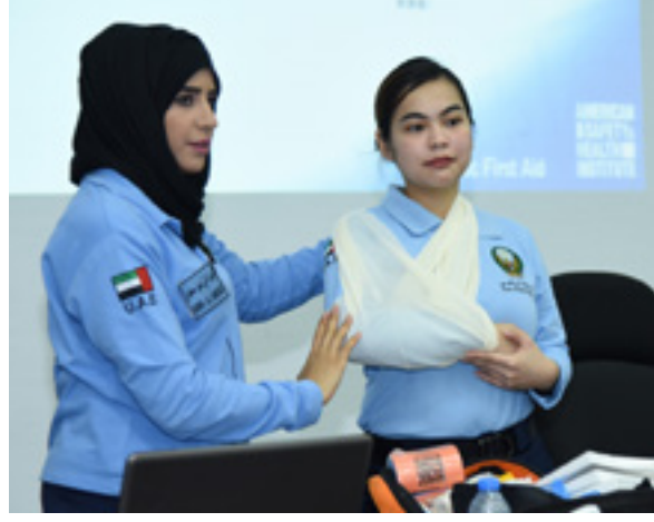
تنظيم فعاليات ثقافية متنوعة لنشر الوعي بين الطلبة وتعزيز ثقافتهم