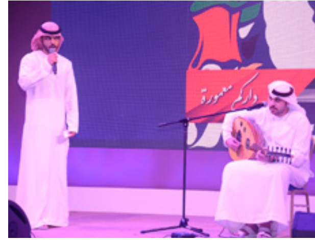
AAU students participate in "Zayed Al Khair Convoy" to promote good values of the Father, Sheikh Zayed bin Sultan Al Nahyan.