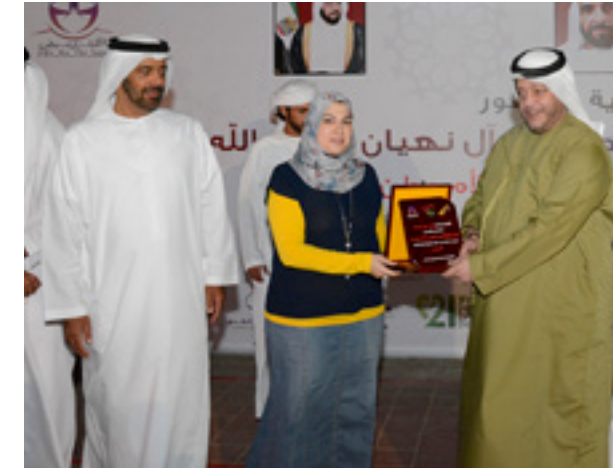
مشاركة جامعة العين في فعالية "الأم وطن" بحضور معالي الشيخ سعيد بن طحون، تهدف لتفعيل دور أصحاب الهمم في المجتمع، وتقديراً لدور الأمهات