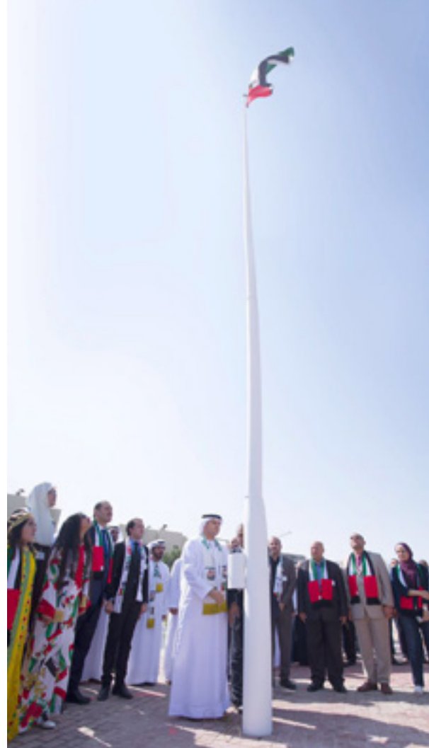
Expressing the highest sense of peace, glory and forgiveness in the "UAE Flag Day".