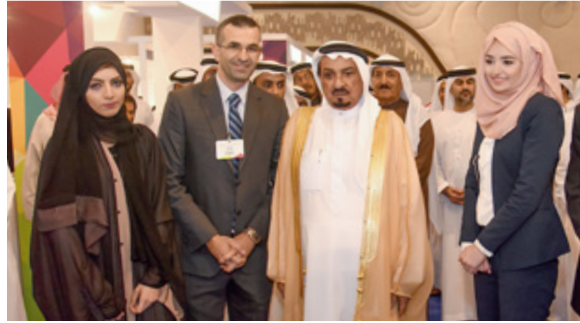
Participating in the education and training exhibitions in the UAE, to guide students and attract ambitious national cadres.