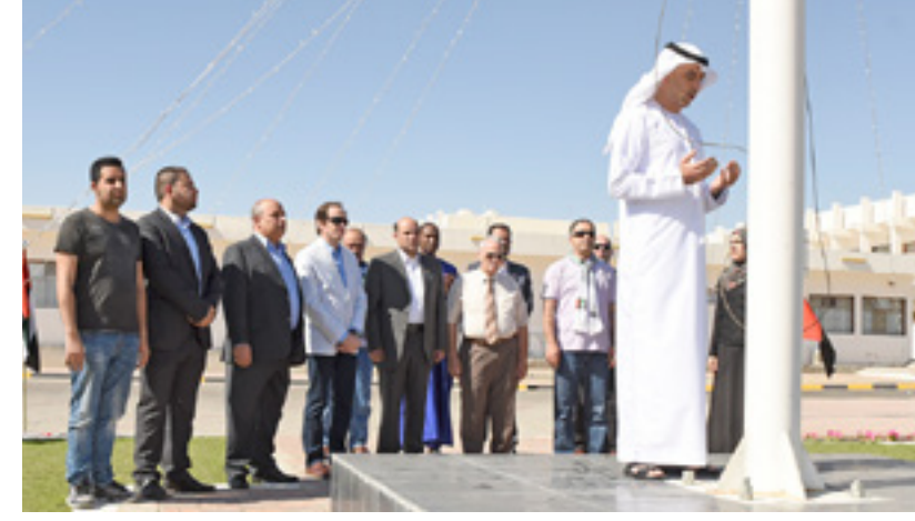
إحياء ذكرى "يوم الشهيد" إحتفاءً بشهداء دولة الإمارات، وتقديراً لأرواحهم المبدولة في سبيل الوطن