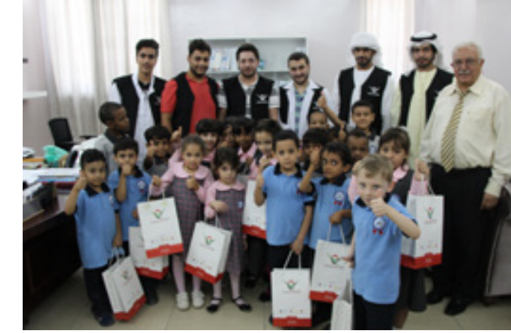
AAU's raising slogan "with learning we grow up" to spread joy among children by distributing school stationery.