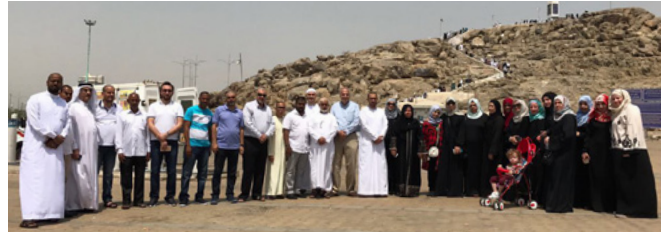
جامعة العين تمنح موظفيها فرصة أداء مناسك العمرة وزيارة الديار المقدسة