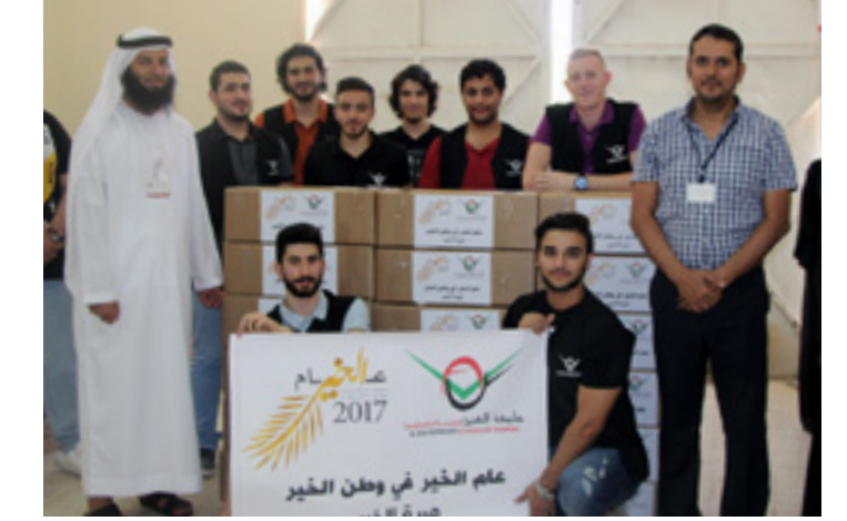
Distributing food baskets to the families in need during the holy month of Ramadan to activate the giving values.