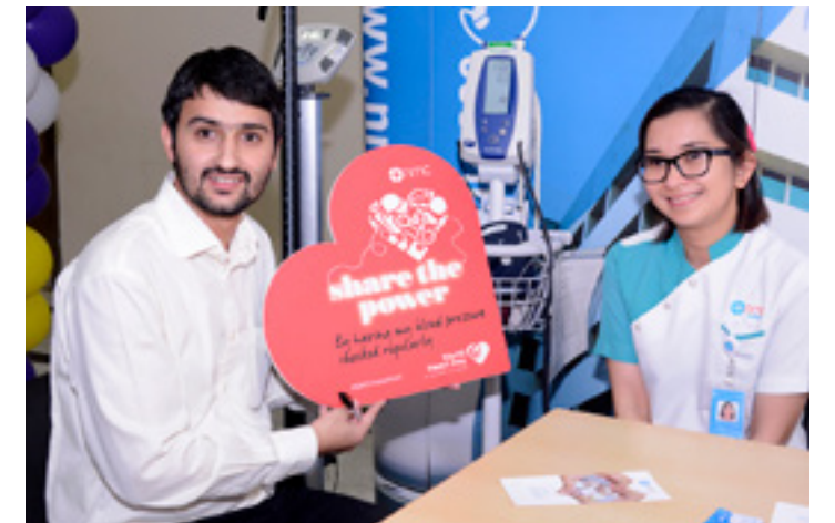
Different healthy activities organized by AAU to promote health awareness.