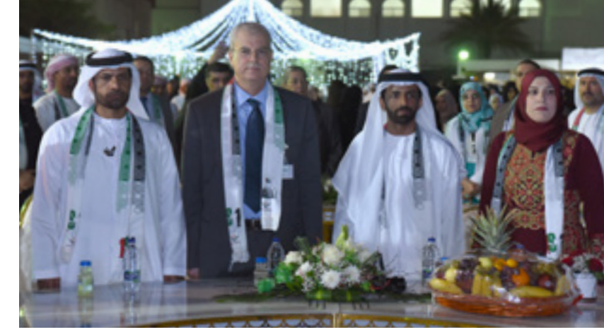
تتألق جامعة العين سنوياً باحتفالات "اليوم الوطني" لدولة الإمارات للتعبير عن قيم الولاء والعرفان للوطن وقيادته الحكيمة