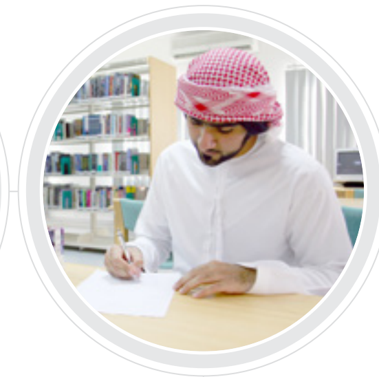
The College of Business obtained full accreditation for Master of Business Administration (MBA).